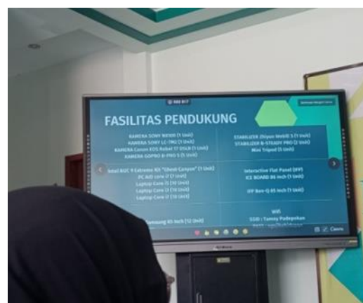
Gambar 3. target internal IBS PKMKK

Selain itu, Dream ini diperkuat oleh hasil wawancara dengan prof. Dr. Ahmad Muhlis selaku direktur utama IBS PKMKK beliau mengungkapkan "bahkan jika hanya 1 atau 2 siswa yang berhasil mencapai kemampuan berbicara dalam bahasa Arab, prestasi semacam itu tetap akan mendapatkan apresiasi yang tinggi dari pihak lembaga." Hal ini menunjukkan komitmen lembaga ini dalam mengembangkan keterampilan bahasa Arab para