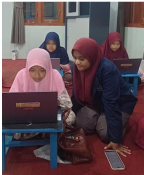
Gambar 4. Membekali siswa kemampuan desain grafis