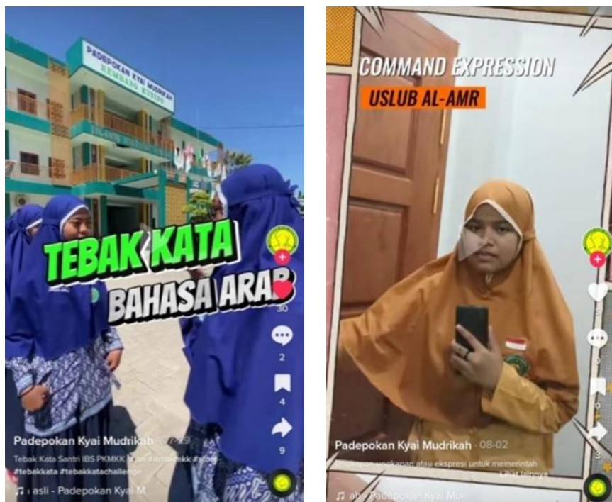
Gambar 5 dan 6: Sampel konten vidio yang telah di Uploud di TikTok