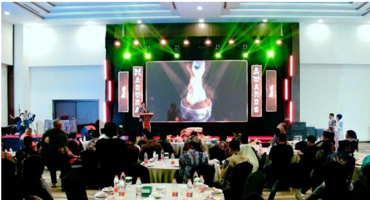
FANTASTIK: PR Cahaya Pro menerima penghargaan di anugerah Madura Awards 2025.

KABAR JATIM | PAMEKASAN – Perusahaan Rokok (PR) Cahaya Pro mendapat penghargaan Madura Awards 2025 Kategori Kontributor Cukai Tertinggi Industri Hasil Tembakau (IHT) 2025, Senin malam (29/12/2025).