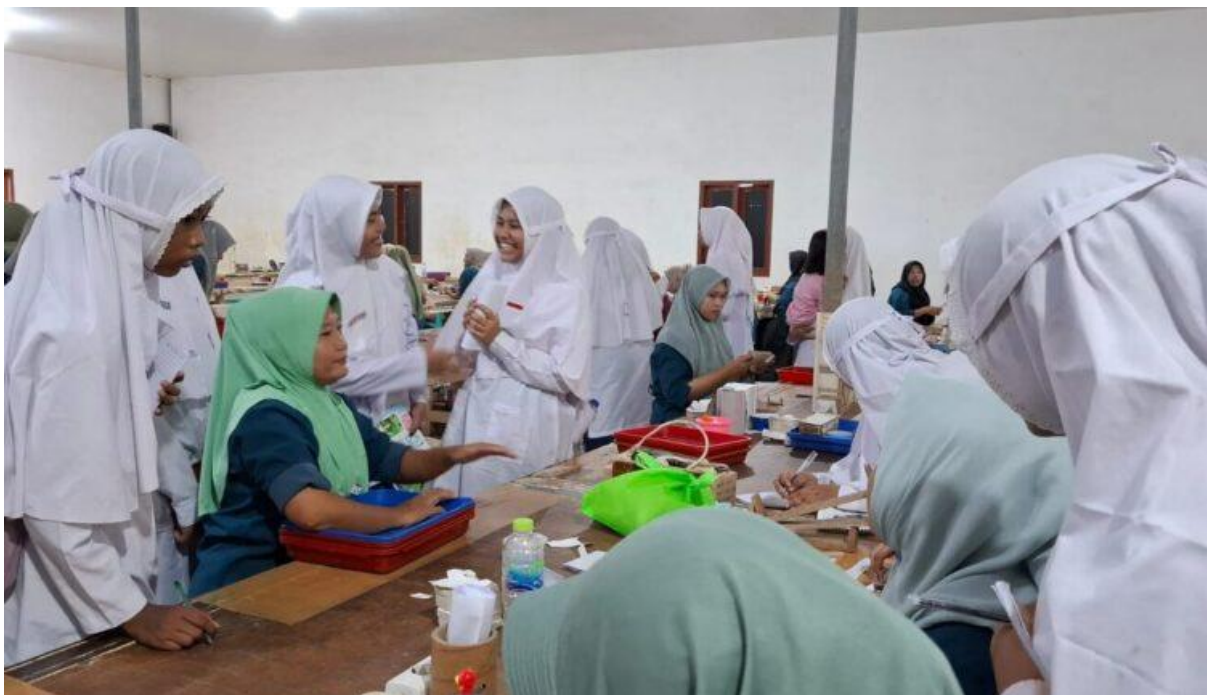
LUAR BIASA: Para santri IBS PKMKK belajar wirausaha di Perusahaan Rokok (PR) Cahaya Pro, Palengaan, Pamekasan.

(rul/zul), Kabar Madura , 6 Januari 2026, News